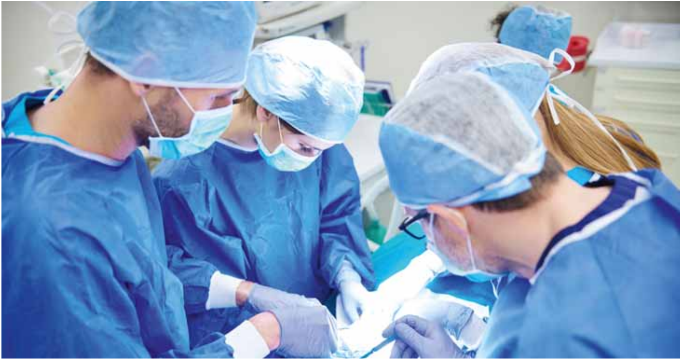
Zorgprofessionals werken veel samen. Bij samenwerking tussen organisaties heeft de or adviesrecht.

naar voren worden gebracht, of, in een latere fase, de or verwijt dat zijn bedenkingen te laat komen. De Ondernemingskamer legt de verantwoordelijkheid van het goed verlopen van het gefaseerde medezeggenschapstraject bij de ondernemer. Het advies moet dus van wezenlijke invloed kunnen zijn op de te nemen besluiten.